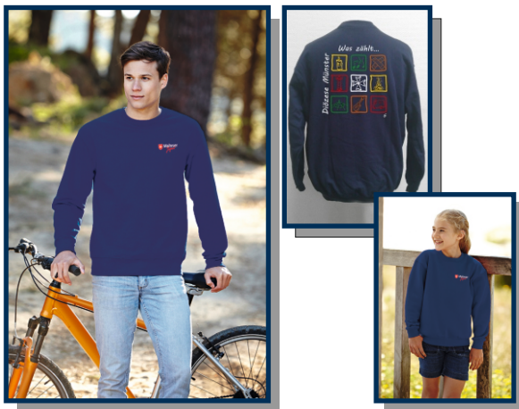
Sweatshirt "Diözese Münster"