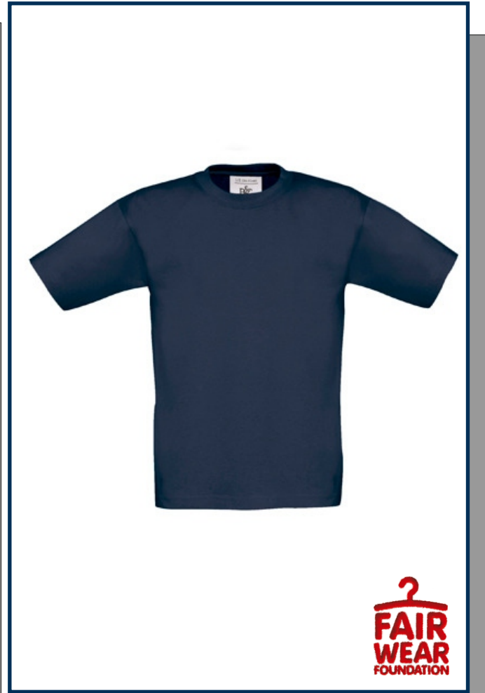
Artikel-Nr. PDBCTK300 (Kids)