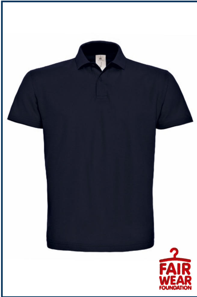
Artikel-Nr. PDBCPUI10 (Unisex)