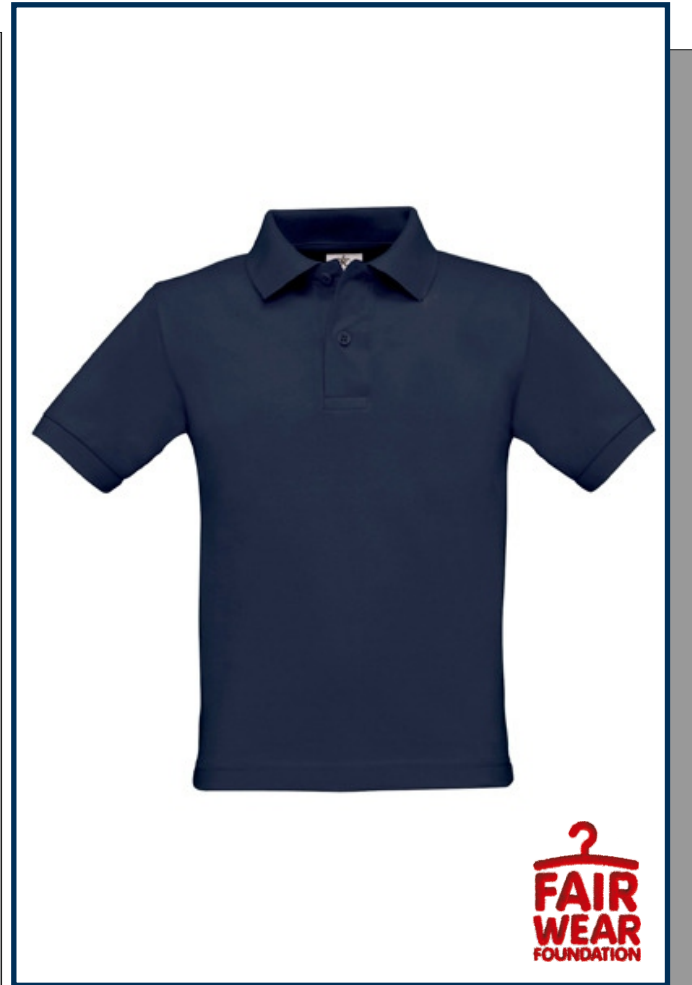
Artikel-Nr. PDBCPK486 (Kids)

Kinder - 110/116, 122/128, 134/146, 152/164