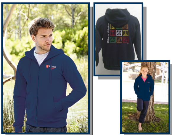
Zoodie "Diözese Münster"