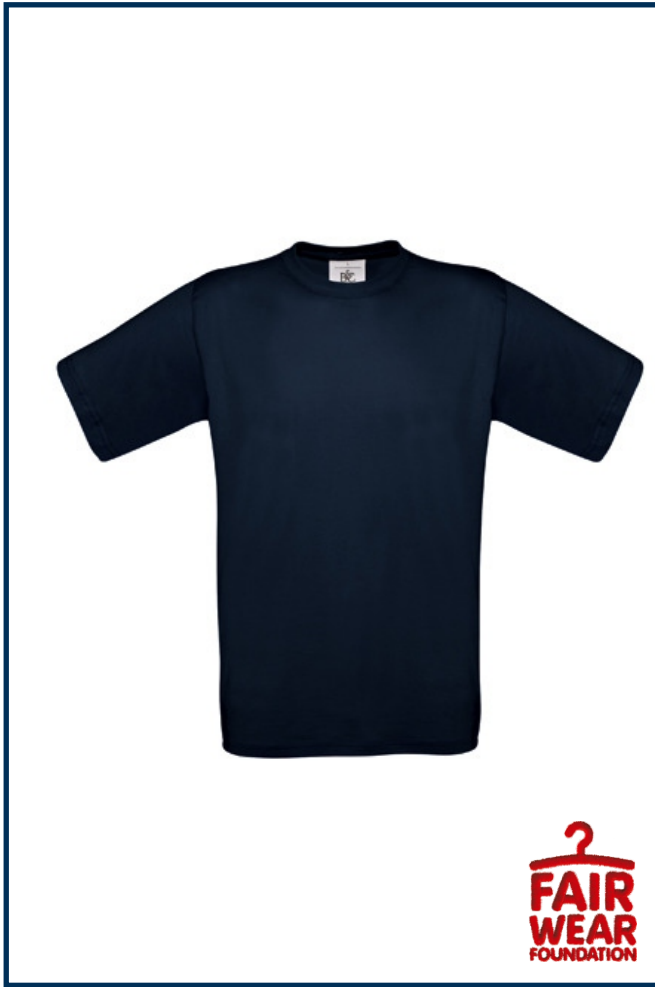
Artikel-Nr. PDBCTU002 (Unisex)