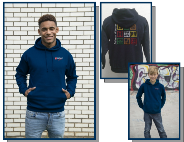
Hoodie "Diözese Münster"