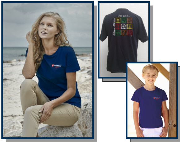
T-Shirt "Diözese Münster"