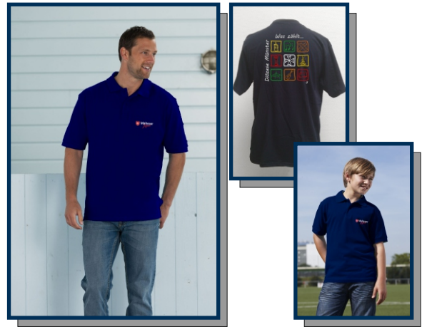
Polo-Shirt "Diözese Münster"